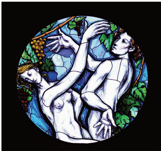
Cattedrale San Pietro Apostolo (Cerignola), Adamo ed Eva , vetrata istoriata, Ernesto Lamagna, 2005.