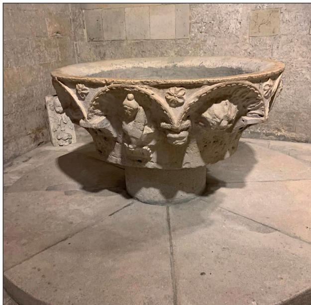
Basilica Santo Sepolcro (Barletta), Battistero , sec. XIII.

MISTAGOGIA DELLA VOCAZIONE AL MATRIMONIO E DELLA ECCLESIALITÀ DEL MATRIMONIO