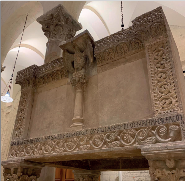
Concattedrale Beata Maria Assunta in cielo (Troia), Pulpito , sec. XII.