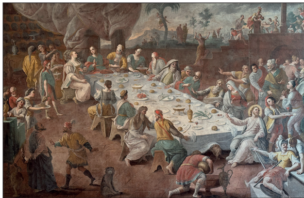
Palazzo Arcivescovile (Taranto), Nozze di Cana , olio su tela, ignoto, sec. XVII-XVIII.

DALLA CELEBRAZIONE DEL MISTERO NUZIALE ALLA COMPRENSIONE DELLA VOCAZIONE MATRIMONIALE PER UNA ESISTENZA SPONSALE ( lex orandi – lex credendi – lex vivendi )