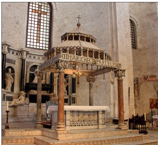
Basilica Pontificia di San Nicola (Bari), Ciborio di Eustazio , sec. XII.

PIENEZZA DELL'ALLEANZA TRA DIO E L'UOMO, TRA CRISTO E LA CHIESA, TRA LO SPOSO E LA SPOSA